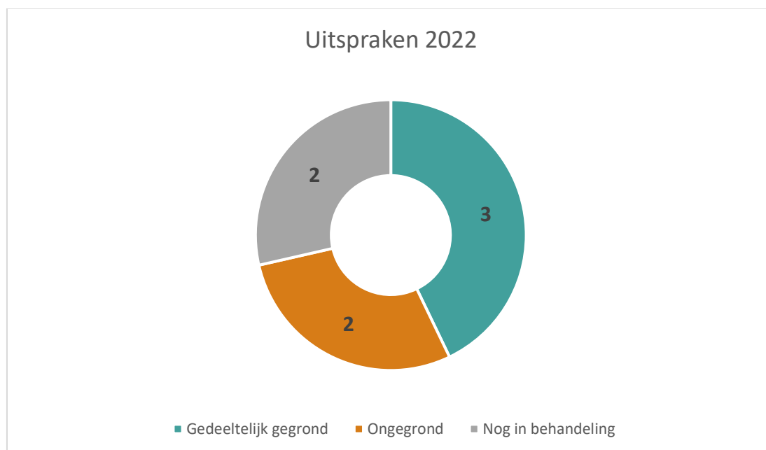
Afbeelding 2: verdeling van adviezen van de Geschillencommissie